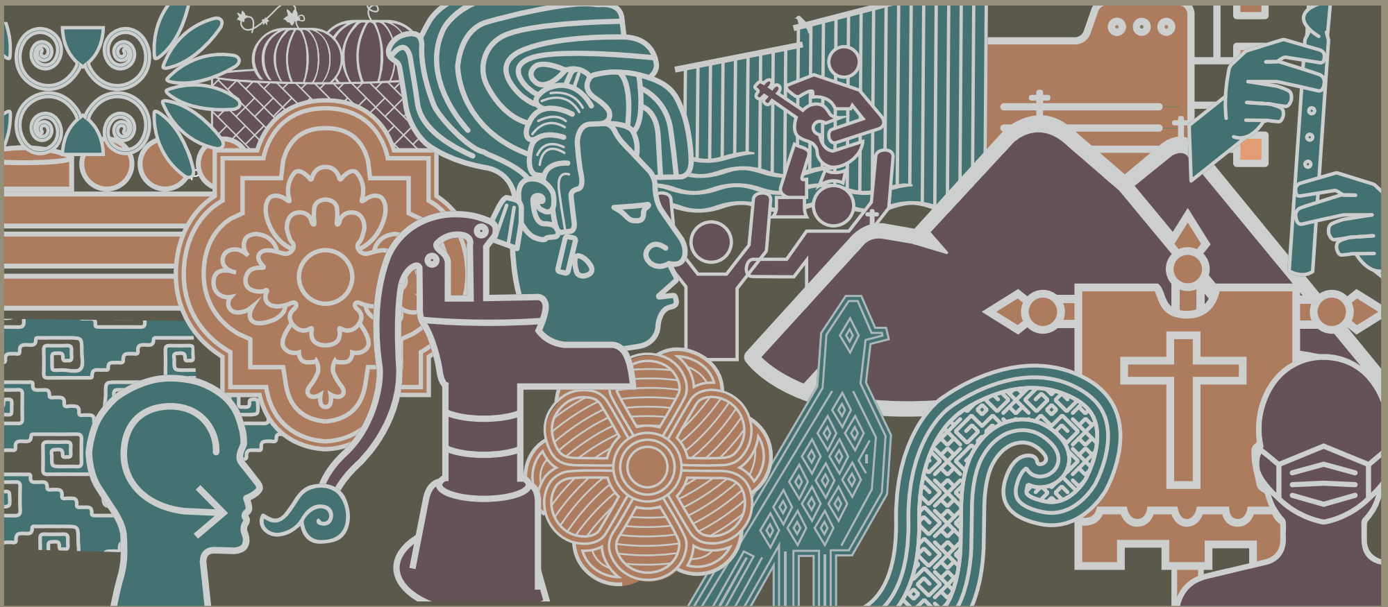
Ilustración: Joana Morayta Konieczna, PRONE, 2022